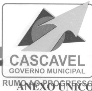
TABELA DE VENCIMENTOS